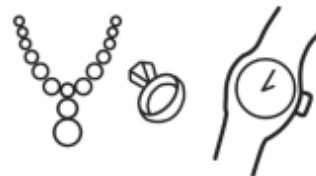
Je mag geen sierraden of een horloge om.