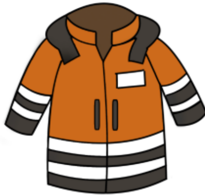
de signaalkleding: het hesje of de jas Let op! Lange mouwen