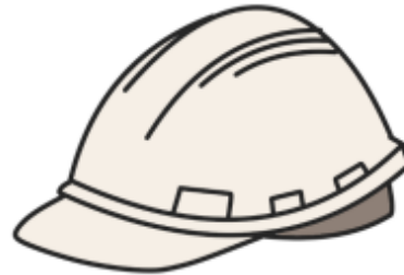
de helm of de veiligheidschap