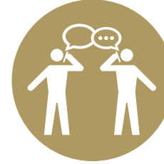
Betrek alle lagen van de organisatie